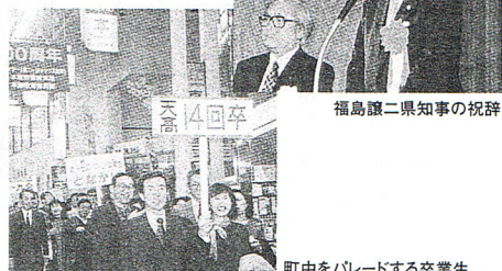
福島県二県知事の祝辞