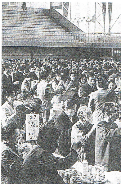
老いも若きも心は一つ(楽しい祝賀会場)

東京の奥座敷である湯河原の温泉郷で湯船につかりながら、懐かしい学生時代の思い出話や、その後の人生を語り合う総会と致しました。翌日は箱根方面の観光(貸切バス)を予定。先に往復ハガキでご案内致し一応締切りまし