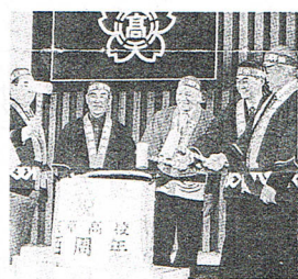
さあ、祝宴が始まる!