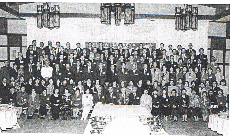
天草高校 昭和38年卒 還暦大同窓会 H16.10.16 於 天草国際ホテルアレグリア