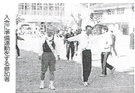
入念に準備運動をする参加者

母校創立百十年を記念し、陸上部・創部八十周年記念「百十キロ駅伝大会を現役部員、陸上部OB会が計画、実施した。 陸上部OB約七十人であった。 グラウンド一周二百メートル、三チームの合計時間を含め六時間五十分、五分六分であった。この駅伝は、母校のグラウンド五百五十周を走ったこととなる。