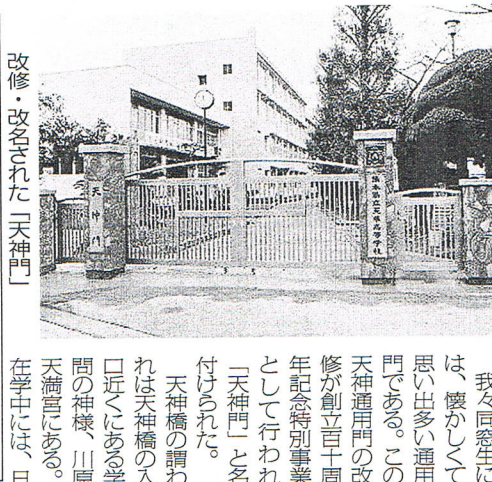
改修・改名された「天神門」

我々同窓生には、懐かしめて思い出多い通用門である。この天神通用門の改修が創立百周年記念特別事業として行われ「天神門」と名付けられた。天神橋の謂われは天神橋の入口近くにある学問の神様、川原天満宮にある。在学中には、日