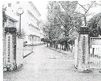
改修前の天神通用門

通学の八〇以上の生徒が過去も現在も天神橋を渡り、天神通用門から登下校をしている。