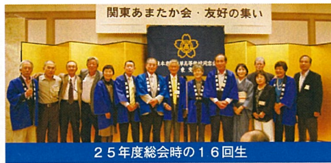
25年度総会時の16回生

私達16回生は終戦の年とその前後生まれで出生数も一番少ない貴重？な子ども達でした。