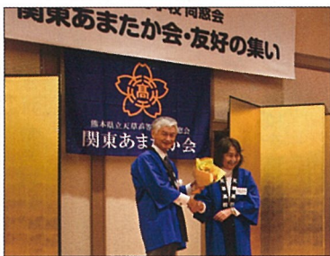
花束贈呈 8年間お疲れ様でした