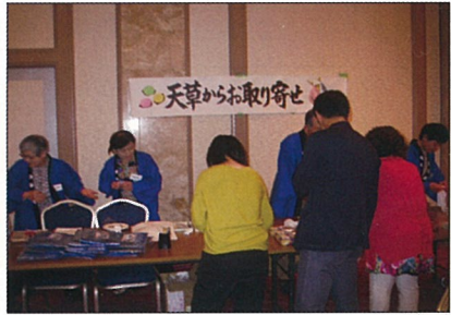
天草物産品販売 おかげさまで完売しました