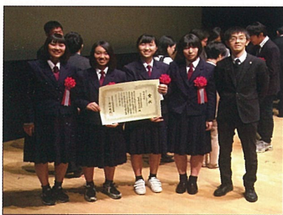
STI for SDGsアワード授賞式 於：日本未来科学館