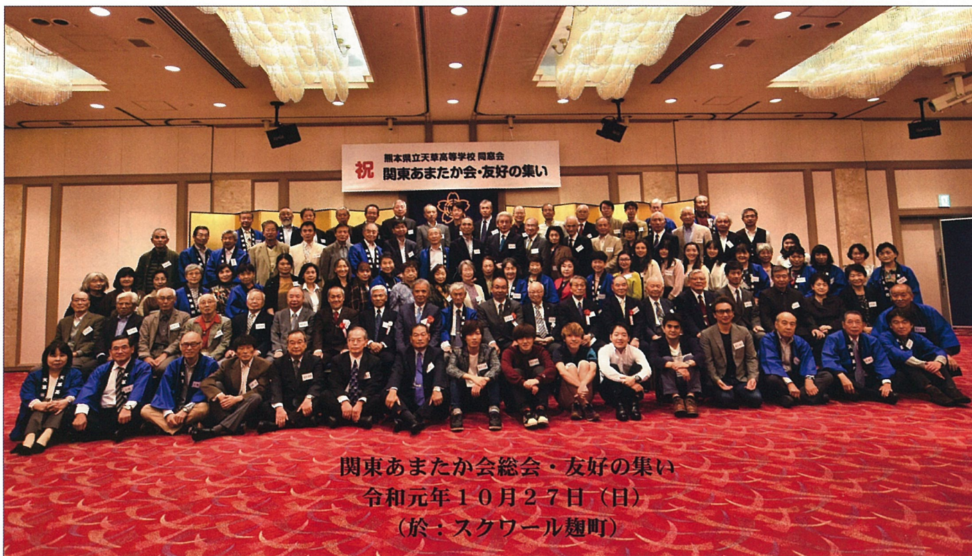
関東あまたか会総会・友好の集い 令和元年10月27日（日） （於：スクワール麹町）