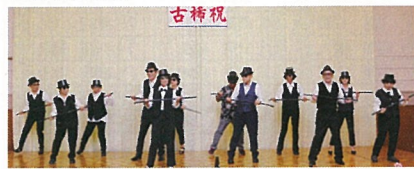
▲ピンクラの恋の季節