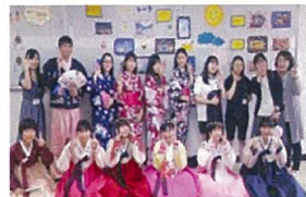
▲韓国土坪高校との交流

研究発表大会にて九州大会出場、 美術部が県写生大会特選、植物被 服部が伝統的天草更紗に挑戦する など、こちらも活発に活動してい ます。 また、10月に開催された文化祭 では、展示、ステージ、バザーと 感性と表現力あふれる発表が行わ れました。進路実現を目指す3年 生を励ます企画もあり大変盛り上 がりました。韓国土坪(ドレジョン) 高校から訪問団を迎え国際交流も 行ったところです。さらに、地域 貢献活動としてボランティア活動 にも積極的に取り組んでいます。 10月には、定時制・通信制文化 大会が開催され、本校からは生徒 全員で作成した大江天主堂のモザ イクアートの展示、ステージ発表 を行いました。 このように、学校行事や部活 動を通して、雛鵬達が翼を鍛え、 日々成長しているところです。こ の春には、卒業生が関東の地にお 世話になります。これまで同様に 声をかけていただければと存じま す。おわりに、天草に帰省された 折には、より魅力を増している母 校にも是非お 立ち寄りくだ さい。今後と も御支援いた だきますよう によりしくお 願い申し上げ ます。