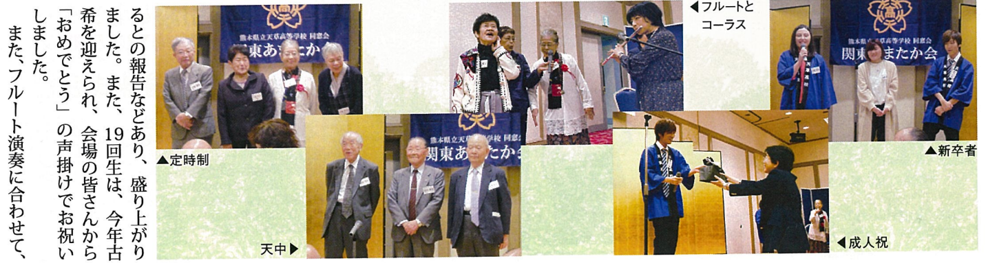
◀フルートとコーラス

その後は、卒回生毎に自己紹介。ステージに上がると皆さん元気な顔と声で、色々とお話してください。卒寿の先輩が張りのある元気な声でしかもスマホを愛用してい