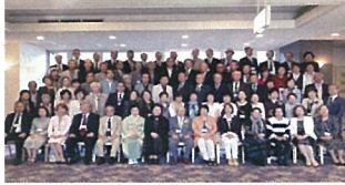
▲ 15 回生会卒業 55 周年記念