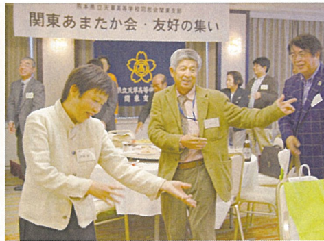
皆で輪になって炭坑節踊り