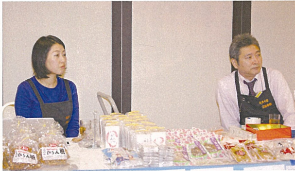
あまくさ宝島市場の物産展

7月、天草で18回卒の同期会があり、帰郷したのを機にレンタカーを借りて物産品の下調べに出