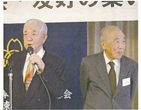
学年毎の自己紹介(天中卒生)