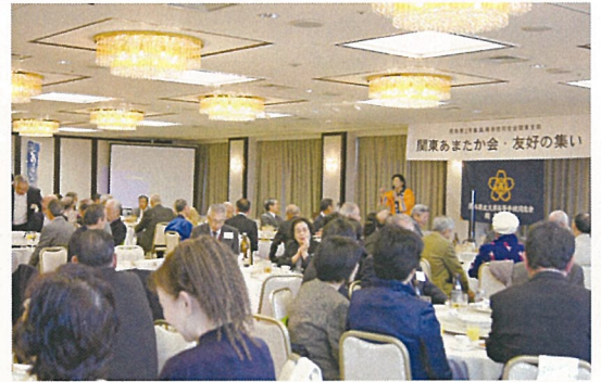
会場の全体雰囲気

【友好の集い】 親睦を図るためにはお互いに何処の誰だか顔と名前(旧姓)が分らなければ進みません。何はともあれ、自己紹介からです。ここで出席者の皆さんには《あなたとの繋がりを》見つけて頂きたかった。横の繋がりがだけではなく、縦(先輩・後輩)の繋がりを見つけて頂こうと思いました。これが同窓会ではないでしょうか? 今回は、途中から皆さんのボルテージも上がり賑やかになって、折角の自己紹介の声も聞き取り辛くなりましたが、今回は人の話にも耳を傾けて頂けると有難いです。一度しか参加しなかった人がいます。「誰も知っていない人がいなかった」と・・・そうではないのです。 どこの誰が出席しているのかわからなかっただけです。貴方に取って《繋がりのある人》を見つけてください。 同窓生の輪を広げましょう。