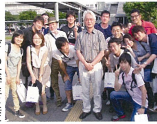
ゼミの大学生と共に

います。それらが羅針盤となつて、挫折や想定外をあまり深刻に捉えずその都度乗り越え、自然命・人・社会に関心を深めながら自分の中で何とか一貫した研究人生を送ることができたような気がします。