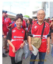
早速「マダム」と声をかけられ、何かいい気分。まる

ツアーは近郊のロートレック生誕の地や美術館を訪ね、今宵の宿は美しい村に高く聳える13世紀の古城。貴族気分浸った。その後帰国する仲間達と別れ、地中海沿岸を列車でニースへ。乗り換えの港町マルセイユで、「母を訪ねて…」のマルコを思う。映画祭のカンヌ、銀巴里の女王・瀨間千恵さんのシャンソンに歌われる「想い出のサントロペ」近くを通る。この旅での不安は、列車に大きな荷物を積み込む事。発車十分前まで番線が知らされず、駅員は不親切で指定車両を見つけないのも一苦労。駅の有料トイレでコインの持ち合わせがなく慌てた。駅まで二度予行練習をし、エレベーターの位置確認をしていたので無事乗り込むことが出来た。段差の高い入り口で荷物を引き揚げてくれたムッシュありがとう。やれやれ。ホット一息。TVGがニースに到着。ここではリゾート気分を味わいたいと、プライベートルビーチを持つホテルを予約。