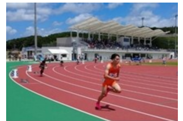
九州地区大学体育大会陸上競技