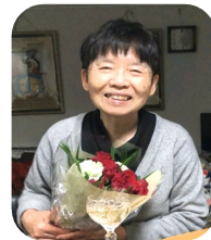
「グリーンランドだ。」 突然眼下に広がる雪と氷の島。2023