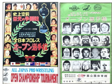
オールスター選手権(1975年)のパンフレット(左)と、その時の入場券(右)

ニューヨークの景色を一望しました。その後は、セントルイス・シカゴ・アトランタ・マイアミ・ロサンゼルスなどプロレス有名会場を撮影しました。ロスではファンと日米の雑誌交換をしました。帰国後、プロレス雑誌発行のベースボール社を訪ね編集長にアメリカのプロレス旅を熱く語り写真を見せたところ、版權を譲って欲しいと言われネガを渡しました。暫くしてプロレス雑誌に写真が掲載され、その雑誌は今でも宝物です。 数年前に行ったジャイアント馬場展では、奥様とのラブレターや馬場さんが描いた油絵が展示されていました。馬場さんは、209cm・145kgの大きな体でドロップキック(飛び蹴り)が出来る一方、卓球も上手かったそうです。馬場さんは今でも私のスーパースターです。 新たな趣味ではマジックも始めました。これからも趣味を広げ、楽しく健康第一に過ごしたいと思えます。