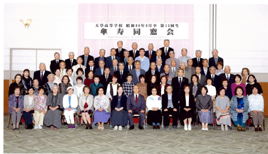
天草高等学校昭和38年3月卒業 傘寿同窓会 令和6年4月22日 於 アマックスサンタカミングホテル

令和6年4月22日「天高昭和38年卒業生傘寿同窓会」が天草サンタカミングホテルにて開催されました。各地から76名が参加しました。う