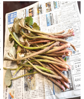
我が家の庭で収穫したツワ

春先の水も温む頃になると、庭の植木鉢の木の芽も柔らかく芽生え、脇のツワの光沢有る大きな葉の下から柔らかな産毛を纏った若芽も現れ、大好きなツワの季節です(元は天草から届いた5、6株が娘宅と我が家の庭に年々増えて)。30センチ程に伸びると収穫し、水を張ったボールを準備し、皮剥きを。手にアクが付いて黒くなるのを防ぐ為に手をお酢で濡らします(コレで手は黒くならない)。茎を弓なりに曲げながら、皮が途中で切れないで一気に下迄剥けた時の気分の良さ。4、5センチに折り、ボールの水の中へ。サッと硬茹でし、アクを抜き、少量の油で炒めて味付けし、鷹の爪を入れキンピラ風に。次回はお揚げと一緒に煮たり、又山椒の葉の佃煮(これも手作り)を入れて煮たりと味変を。子供の頃野山でツワを取りに行き、母が作ってくれた味を思い出しながら、舌鼓を打ち、至福のひと時を(たかがツワでも・・・)。