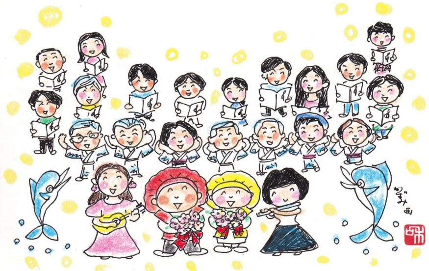
イラスト: 中京支部 吉田和美(高17)