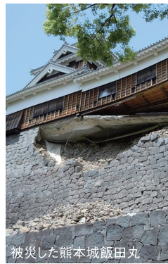
被災した熊本城飯丸

ことで、支援の絆が繋がっていくことになりそうです。天草高校は今年創立百二十周年を迎えましたが、この間良い時代ばかりではなく、戦争等苦難の時代もあり、それら乗り越えながら歳月を積み重ねてきました。そして、歴史はこれからも続いていきますが、当たり前の平常な日々感謝しながら次の時代に繋げていくことが大事だと思います。