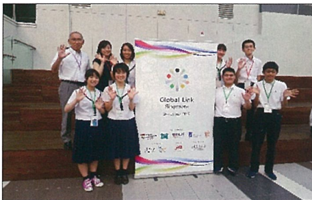
グローバル・リンク・シンガポール 世界大会の会場にて天高出席者全員

「南洋工科大学にて、7月27日昼までとして練習以上の発表を行いました。受賞はなりませんでしたが、自分達の研究成果を世界に発信することができた。また、世界中の高校生の真剣な研究姿勢や研究レベルの高さを学ぶことができた」と報告がありました。立派でした。天高の誇りです。