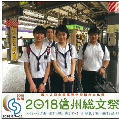
2018信州総文祭 第42回全国高等学校総合文化祭

これから、もっとワクワクすること、逆に辛いこともあるはずですが、しかし天草の地で私を応援してくれている両親はもちろん、お世話になっただ方々の思いを忘れずに一生懸命突き進んでいきたいと思います。