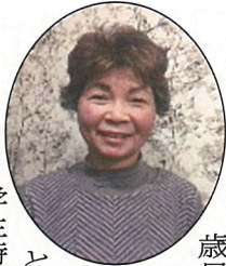
歳月は人を変え る。それは「成長」とも呼ばれる。時に「変節」

学生時代サルトルとマルクスに出会った時は、この2人が世の迷蒙を開いてくれると信じた。だが社会人になって何か違うと感じた。河上肇の命題「人間の心」が置きざりだった。そして還暦を前にあ