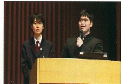
つば・Science・Edge2019にて 博士たちの質問に答える二人

3月22日(金)〜23日(土)に開催された「つばScience Edge 2019」において、天高科学部は、昨年夏の総文祭の教訓を生かし、見事に「探求指回賞」を受賞し、グローバル・リンク・シンガポール(世界大会)への出場権を獲得しました。出場チームは、ポスター発表を含め